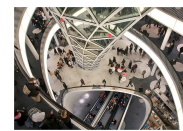
My Zeil, la nuova dimensione dello shopping a Francoforte