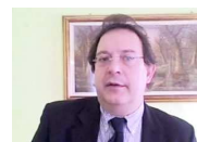
C'è la Gdo nell'obiettivo di Caffè Musetti