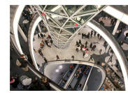
My Zeil, la nuova dimensione dello shopping a Francoforte